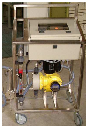
Mode autonome: Contrôle par automate et écran tactile

Cette application permet de programmer la quantité exacte de SO 2 ou d'enzymes à injecter, en fonction du poids de la vendange et de valeurs de doses souhaitées (préprogrammées par l'utilisateur).